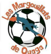
LMDO : nombre de membres et donateurs