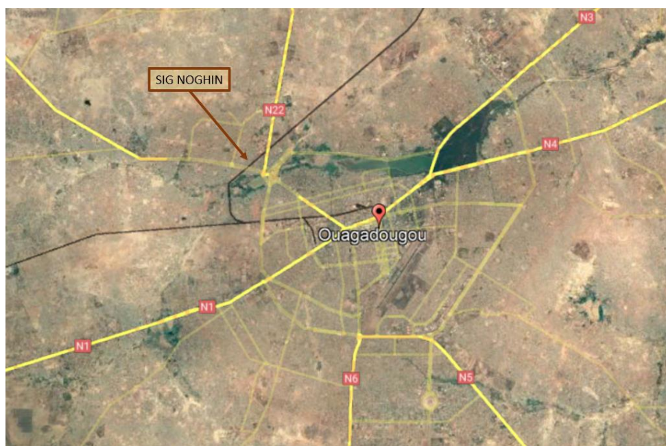
Figure 1 : plan de situation

Le présent projet concerne la commune de Ouagadougou, et plus précisément le quartier Sig Noghin, rattaché à l'arrondissement n° 3 de la capitale Burkinabè. Situé au Nord-ouest du centre-ville, au-delà des « barrages », ce secteur de l'agglomération connaît un fort développement ; il est directement concerné par le Projet de développement durable de Ouagadougou – phase 2 (PDDO2), financé par l'Agence Française de Développement (AFD), et sur lequel l'agence d'urbanisme de Lyon intervient dans le cadre de la coopération décentralisée entre les deux agglomérations.