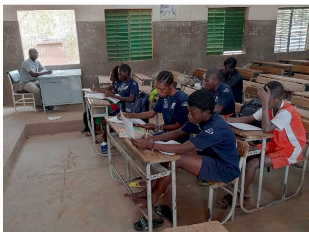
Illustration 6 – cours de préparation aux examens

Ces cours ont été dispensés dans les locaux du lycée Kilwin par les mêmes enseignants vacataires qu'en 2022, avec qui AFOCSI a contracté directement.