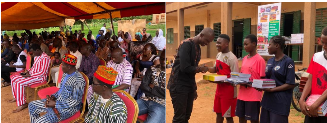
Illustration 7 – journée de clôture de l'année scolaire et sportive (12/08/23)

Le Groupe Hajjar, sollicité par LMDO, a contribué en nature par la fourniture de boissons et viennoiseries.