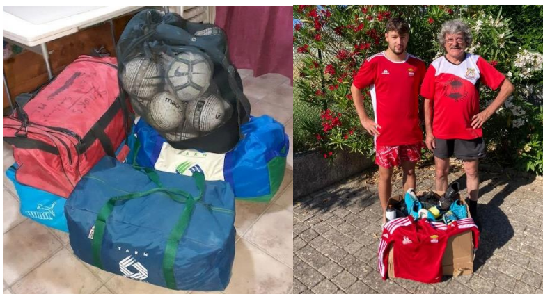
Illustration 3 - matériel récupéré (US Cordes, AS Toussieu)

Le conteneur est parti de Lyon le 21 septembre 2023 et est arrivé à Ouagadougou courant décembre. Les formalités de sortie de douane n'étaient pas terminées à la fin de ce mois.