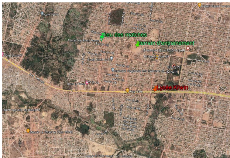
Illustration 5 – localisation des terrains utilisés par AFOCSI

Suite à cette situation, des échanges informels ont été engagés avec la Commune (arrondissement et service des sports). Le sujet a été évoqué entre AFOCSI et LMDO, cependant aucune démarche officielle n'ayant été entreprise, LMDO n'est pas intervenu auprès de la Mairie comme cela avait été envisagé.