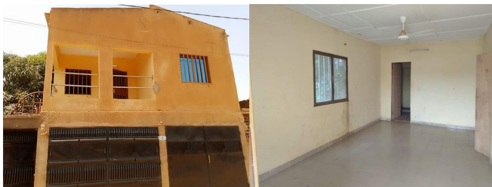
Illustration 8 – local de la bibliothèque Zoodo

Un local a été loué par AFOCSI à partir de mars 2023, et les aménagements et équipements prévus ont été réalisés par AFOCSI, et quelques ouvrages récupérés localement pour amorcer le fonds documentaire.