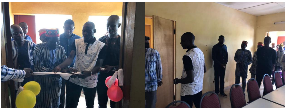
Illustration 5 – inauguration de la bibliothèque