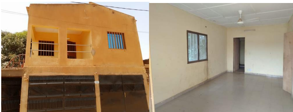
Illustration 1 – photos du local (intérieur et extérieur)

Le loyer est fixé à 60 000 Francs CFA par mois, hors abonnements eau électricité qu'AFOCSI a contracté par ailleurs.