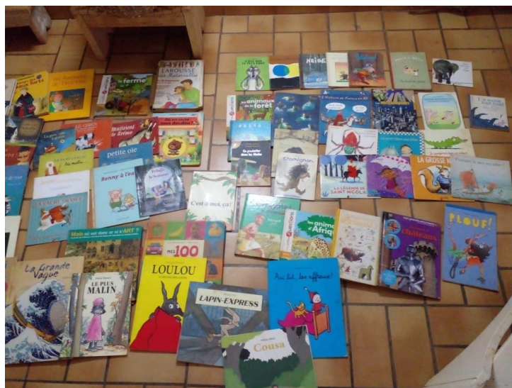
Illustration 3 – livres collectés à Ouaga (enseignants St Exupéry)

A Ouaga, AFOCSI a pu récupérer des ouvrages donnés par des particuliers (73) et par un groupe d'enseignants du lycée St Exupéry (123), suite à un contact pris par LMDO. Ces 196 ouvrages ont été mis en rayon.