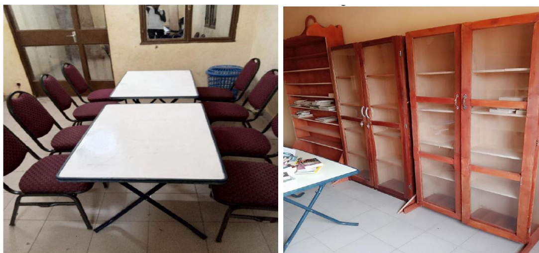
Illustration 2 - mobilier acquis

Quelques menus travaux de remise en état (serrures, garde corps, éclairage, ...) ont été effectués pour rendre l'étage utilisable pour la bibliothèque ; il a ensuite été procédé en deux temps à l'acquisition de mobilier et de matériel pour le rangement des ouvrages, l'accueil du public et la gestion de la bibliothèque (cf. détail en annexe 3) Des panneaux indicateurs ont également été conçus et acquis pour signaler la bibliothèque (1 sur façade + 2 dans la rue).