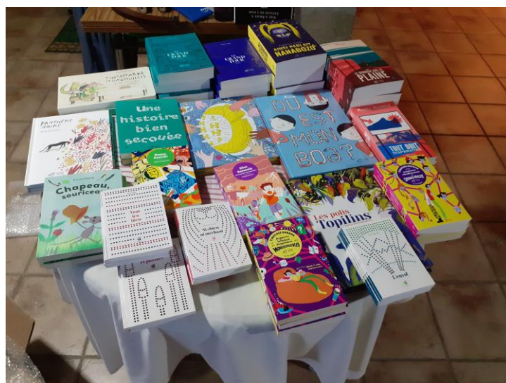
Illustration 4 – livres donnés par les Editions Thierry Magnier