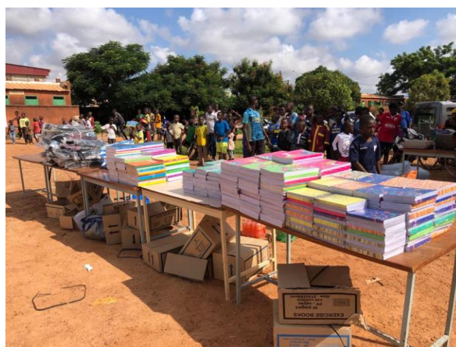
Illustration 6 – remise des fournitures lors de la journée d'excellence

Dans le cadre du partenariat, LMDO a pris en charge intégralement l'acquisition des fournitures et contribué aux dotations de bourses d'études (cf. §5).