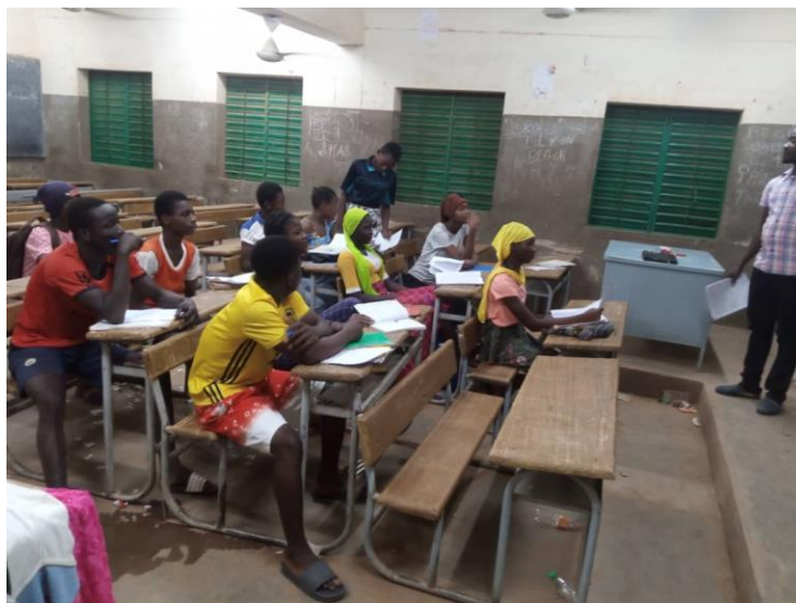
Illustration 5 – cours de préparation aux examens (classe de 3 ème )