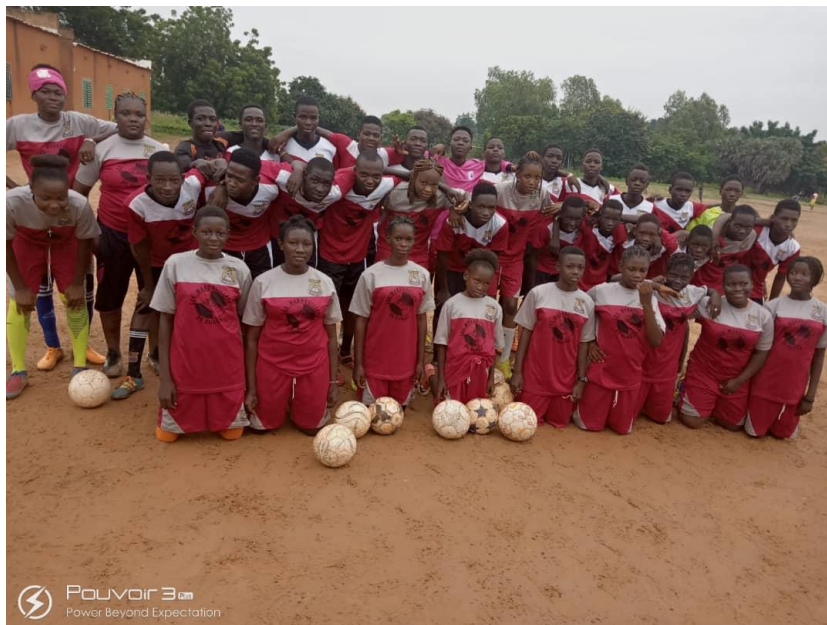
Illustration 4 – tenues officielles des équipes AFOCSI

Comme prévu dans le programme arrêté fin 2021, les trois (3) équipes (cadets, minimes, féminines) d'AFOCSI ont été dotées de tenues complètes officielles pour les compétitions (maillot, shorts, bas). Les soixante douze (72) pensionnaires d'AFOCSI s'étaient auparavant vu remettre une paire de chaussures de football.