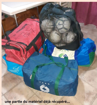
une partie du matériel déjà récupéré...