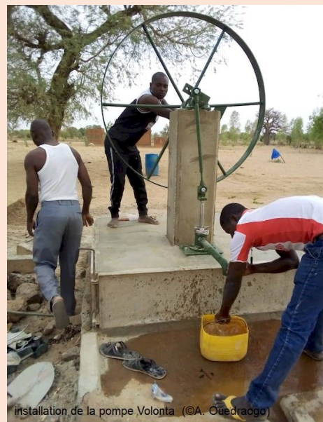
installation de la pompe Volonta

C'est déjà le cas de la formation des enseignants programmée par le CEAS fin mars.